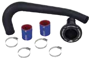
1 フリーフローエキゾーストキット (税別) RK16090-08 KAW ULTRA260/300 ¥44,280 ¥41,000