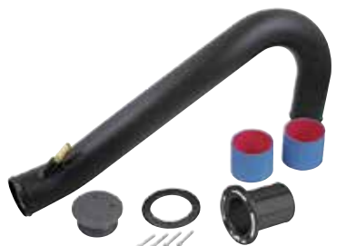
13 リアエキゾーストキット (税別) RS15050-1 RXP-X255/RXT-X255/RXP215/RXT215/GTX215 ¥45,360 ¥42,000