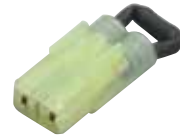
6 キャットセンサーバイパスチップ (税別) 802-12001 YAM GP 1200R / GP 1300R('05) / XLT 1200 ¥3,240 ¥3,000