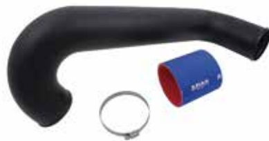
5 フリーフローエキゾーストキット (税別) RY16070 YAM FX SHO(2012-) ¥34,560 ¥32,000