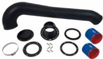
4 リアエキゾーストキット (税別) RY15060 YAM VXR/VXS ¥59,400 ¥55,000