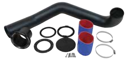
6 リアエキゾーストキット (税別) RY15070 YAM FX-SHO(2012-) ¥60,480 ¥56,000