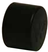
7 エキゾーストレゾネーターリムーバブルキット (税別) 332-18005 YAM VXR/VXS ¥1,404 ¥1,300