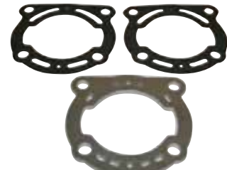
9 パフォーマンスエキゾーストプレートキット (税別) 331-35300 KAW ULTRA300X/300LX ¥14,040 ¥13,000