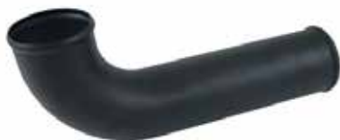
10 フリーフローエキゾーストキット (税別) RS16080 SEA-DOO RXP-X/RXT-X ¥15,120 ¥14,000