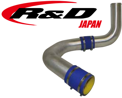
1 フリーフローエキゾーストキット (税別) 333-80258 SD RXP-X260 ¥43,200 ¥40,000