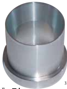
8 エキゾーストパワースリーブ (税別) 331-80000 KAW SXR 800 ¥6,048 ¥5,600 332-13001 YAM GP 1300R ¥14,040 ¥13,000