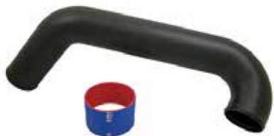
7 フリーフローエキゾーストキット (税別) RY16040 YAM FX SHO(-2011)/FZR/FZS ¥34,560 ¥32,000