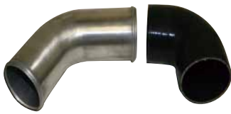
4 フリーフローエキゾーストキット (税別) 332-18006 YAM VXR/VXS ¥33,480 ¥31,000