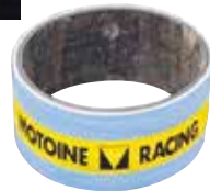
11 強化エキゾーストカプラー (税別)