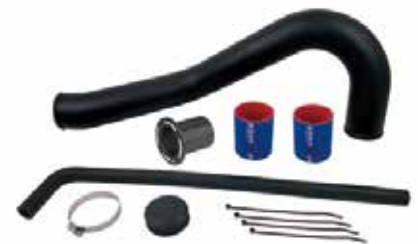
12 リアエキゾーストキット (税別) RS15100-2 S-D RXT-X260(S & a5除く) ¥50,760 ¥47,000