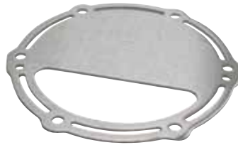
5 Dプレート (税別) 332-12000 YAM GP 1200R / GP 1300R / XLT 1200 ¥15,120 ¥14,000