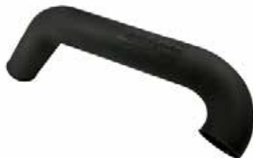
8 フリーフローエキゾーストキット (税別) RY1625 YAM FX140/160/HO ¥18,360 ¥17,000