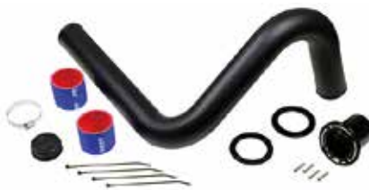
11 リアエキゾーストキット (税別) RS15110-1 SEA-DOO GTR ¥50,760 ¥47,000