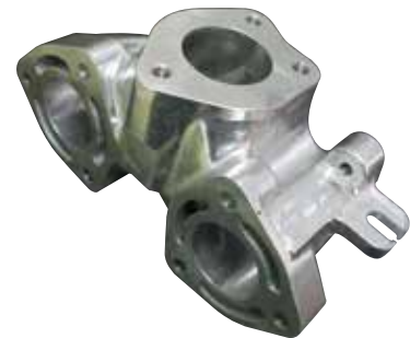
12 エキゾーストマニホールド (税別)