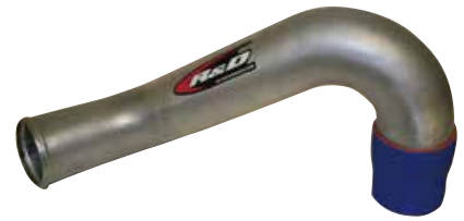
3 ハイフローエキゾーストキット (税別) 332-18000 FX SHO/FZR ¥34,560 ¥32,000