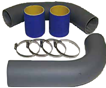
2 フリーフローエキゾーストキット (税別) 333-80255 SD RXP-X255/RXT-X255 ¥54,000 ¥50,000