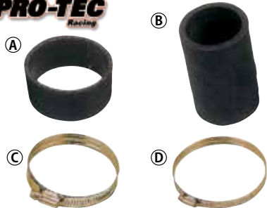
10 スペアパーツ (マッハ1.2エキゾースト用) (税別)