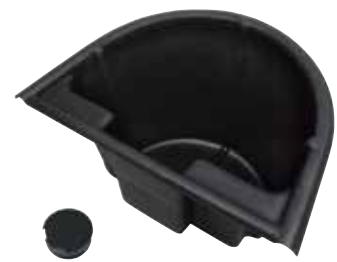
15 リアストレージタブ (税別) RY4-RST-060 YAM VXR/VXS/VX(10+) ¥11,880 ¥11,000