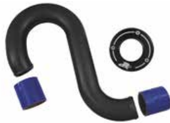
2 フリーフローエキゾーストキット (税別) RK16085 KAW15F(-08) ¥33,480 ¥31,000