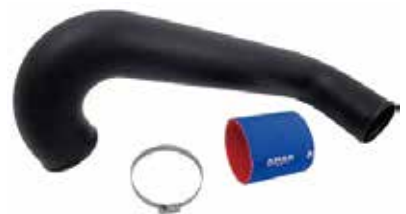
3 フリーフローエキゾーストキット (税別) RY16060 YAM VXR/VXS ¥34,560 ¥32,000