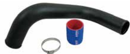
9 フリーフローエキゾーストキット (税別) RS16090 S-D ALL S3 & T3モデル ¥21,600 ¥20,000